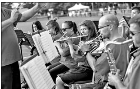
Szólt a muzsika a Lakitelki Tűzoltózenekar jóvoltából.

És következett a Republic. A zenekar koncertje fantasztikus volt. A 2 órás buli alatt szinte az összes jól ismert Republic-dalt hallhatta a közönség. A színpad lépcsőjén állva végeláthatatlannak tűnt a tömeg, rengetegen érkeztek más településről is a tószegi falunapra. A koncert végén, a zenekar néhány éve elhunyt énekesére, frontemberé-