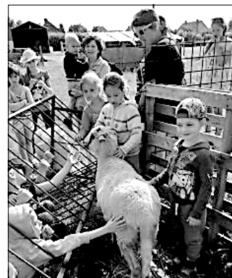
A gyerekek örömmel simogatják az állatokat.

mányozásban, mert az állatok azért szeretnek enni. Önkéntesek vállalnak feladatokat a lovgoltatástól, a gyermekfelügyeletig. Egyébként a középiskolások számára kötelező 50 óras köz-