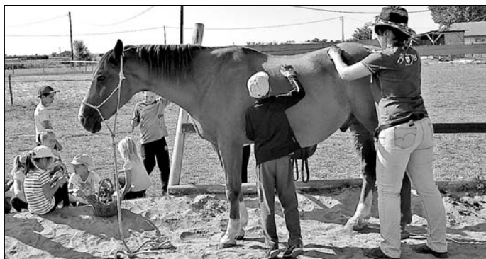
Megtanulják a lovak ápolását is.