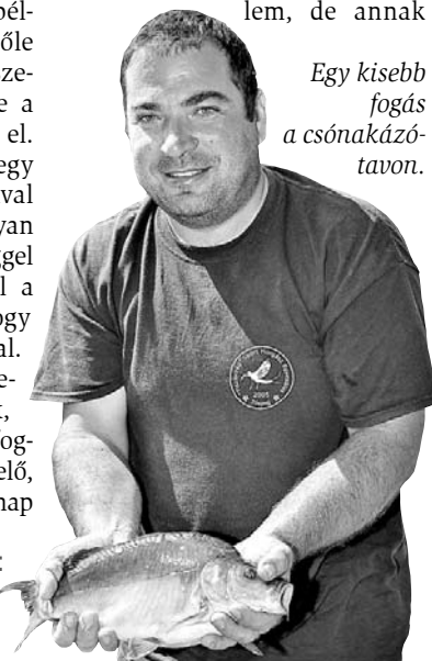
Egy kisebb fogás a csónakázótávon.

Imi eddig legnagyobb fogásai: ponty 9 kg, amúr 15 kg, harcsa 11 kg, keszeg 1,5 kg