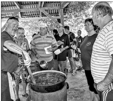
Remek halászlé főtt az üstben. A legügyesebb horgászokat jutalmazták.