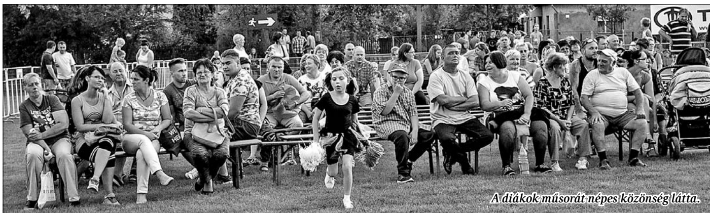
A diákok műsorát népes közönség látta.