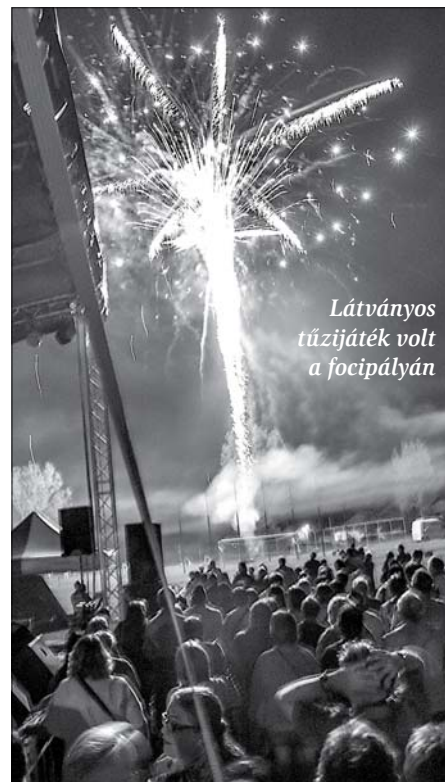
Látványos tűzijáték volt a foci pályán