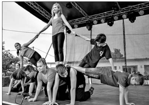
Arcfestéssel ékesített gyerekek, Kis Grófo-átdolgozás és zenés tornagyakorlat

És következett a Republic. A zenekar koncertje fantasztikus volt. A 2 órás buli alatt szinte az összes jól ismert Republic-dalt hallhatta a közönség. A színpad lépcsőjén állva végeláthatatlannak tűnt a tömeg, rengetegen érkeztek más településről is a tószegi falunapra. A koncert végén, a zenekar néhány éve elhunyt énekesére, frontemberé-