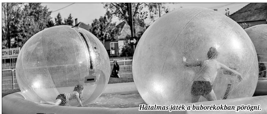
Hatalmas játék a buborékokban pörögni.

Közben a zene hangjaira lassan megteltek a pálya közepén felsorakoztatott padok. Felcsendült a Lakitelki Tűzoltózenekar nyitószáma. Az együttes már tavaly is szerepelt Tószegen. Teljes odaadással, beleéléssel muzsikáltak másfél órán át. A tűző napsütés ellenére szinte alig tartottak pihenőt. Repertoárjukban megtalálható volt minden, mi fülnek ingere, a lassabb művektől a pörgős dalokig.