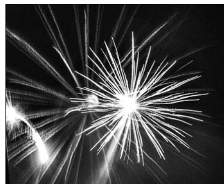
Látványos tűzijátékot láthattak a nézők.