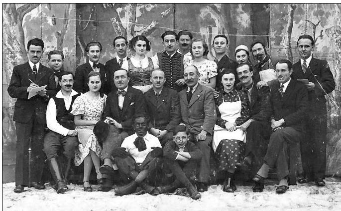
Tószegi amatőr színjátszók. A kép a II. Világháború előtt készült.