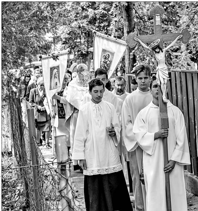
Búcsúi körmenet a katolikus templomnál.