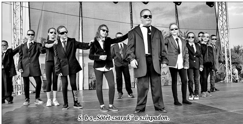
5. b-s „Sötét-zsaruk” a színpadon.

A tavalyi falunappal ellentétben, idén a nap-sütésre nem lehetett panasz. Az első nap programsorozata délután kezdődött. A gye-