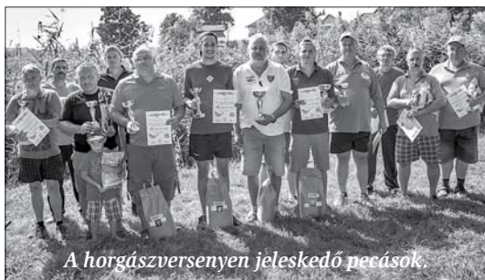
A horgászversenyen jeleskedő pecások.

Hagyományosan, szeptember közepén rendezte meg az önkormányzat a Tószegi Nyárestek rendezvénysorozatát, amely az idén rekordszámú érdeklődőt vonzott. Az első napon a Lakiteleki Tűzoltózenekar