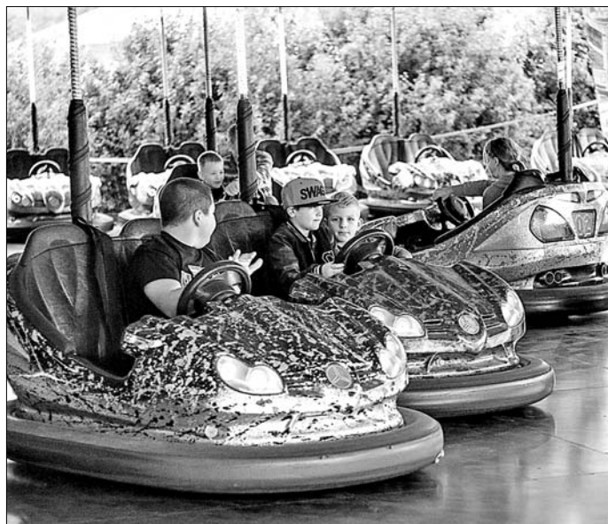
A dodzsem évtizedek óta hódít a fiatalok körében.