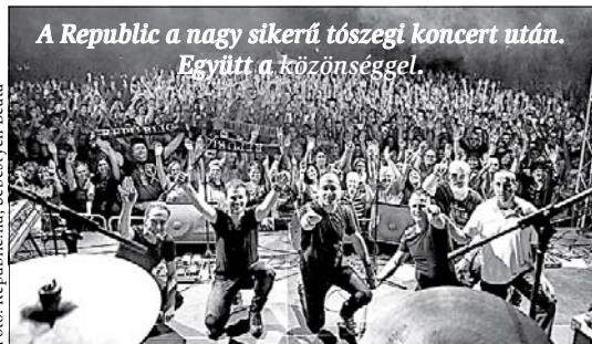
A Republic a nagy sikerű tószegi koncert után. Együtt a közönséggel.